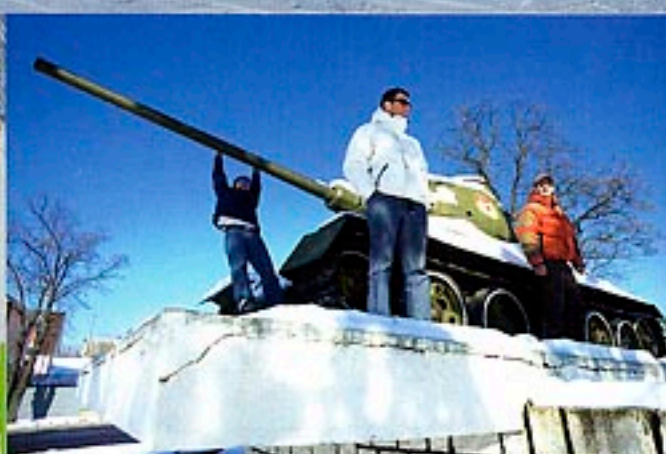
Chez nous, on a des fontaines, eux des T62. Chacun son truc.