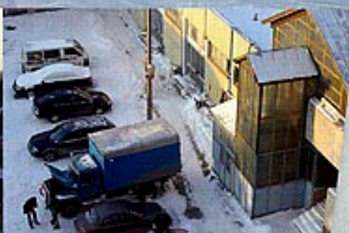
Démarrage au écolumeau, une base.