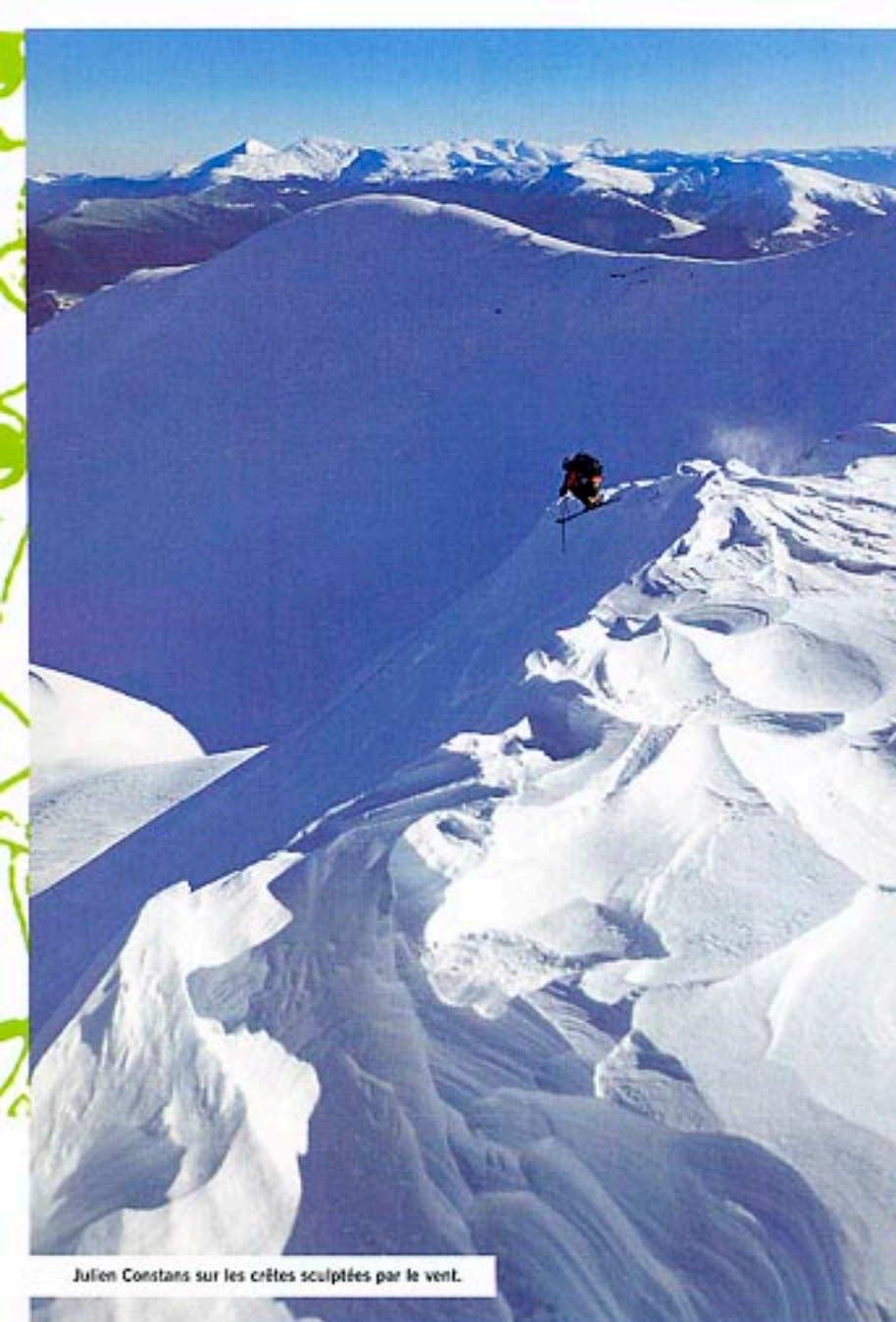
Julien Constans sur les crêtes sculptées par le vent.