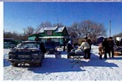
Jour de marché, jour de fête.