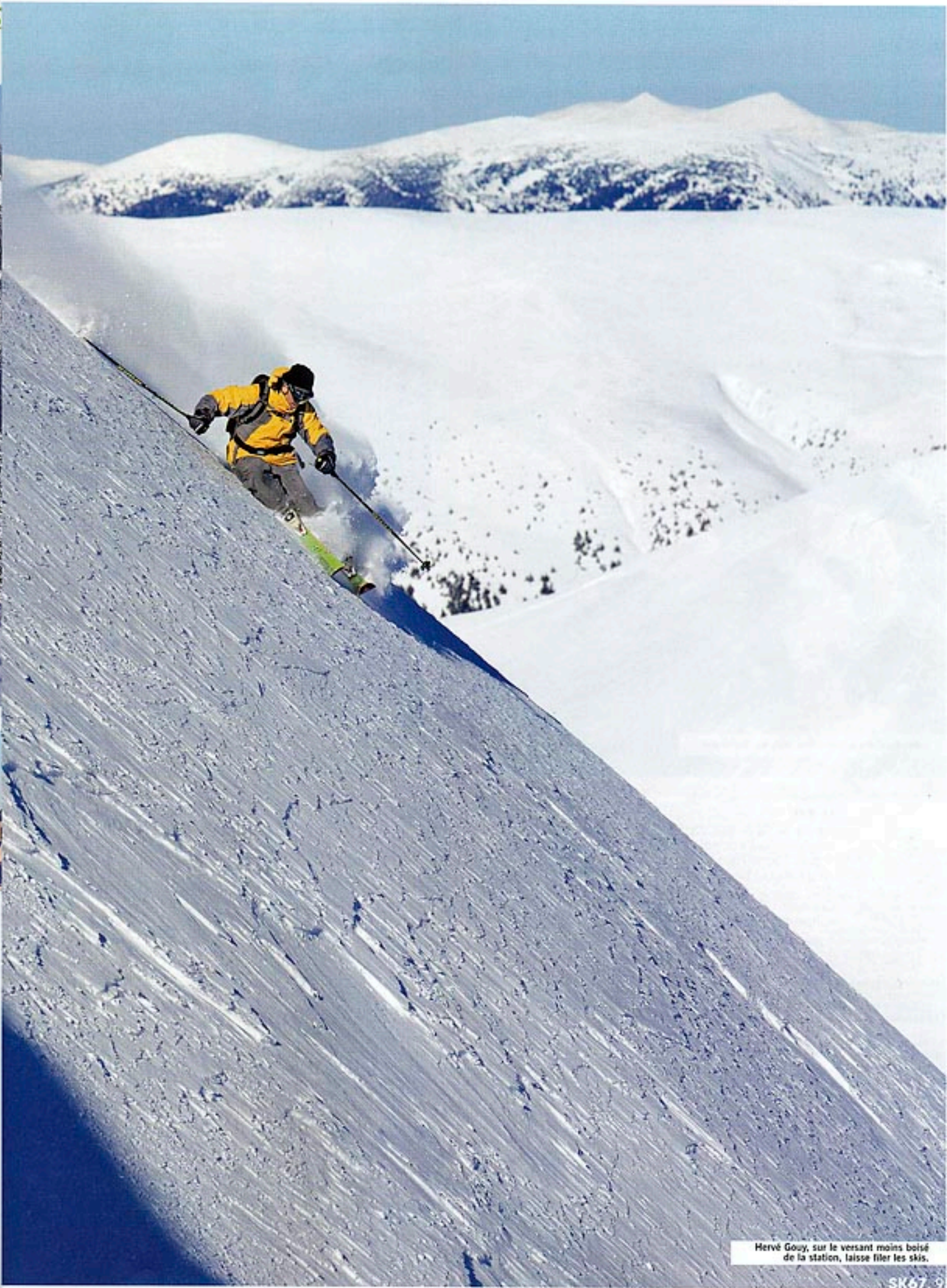
Hervé Gouy, sur le versant moins boisé de la station, laisse filer les skis.