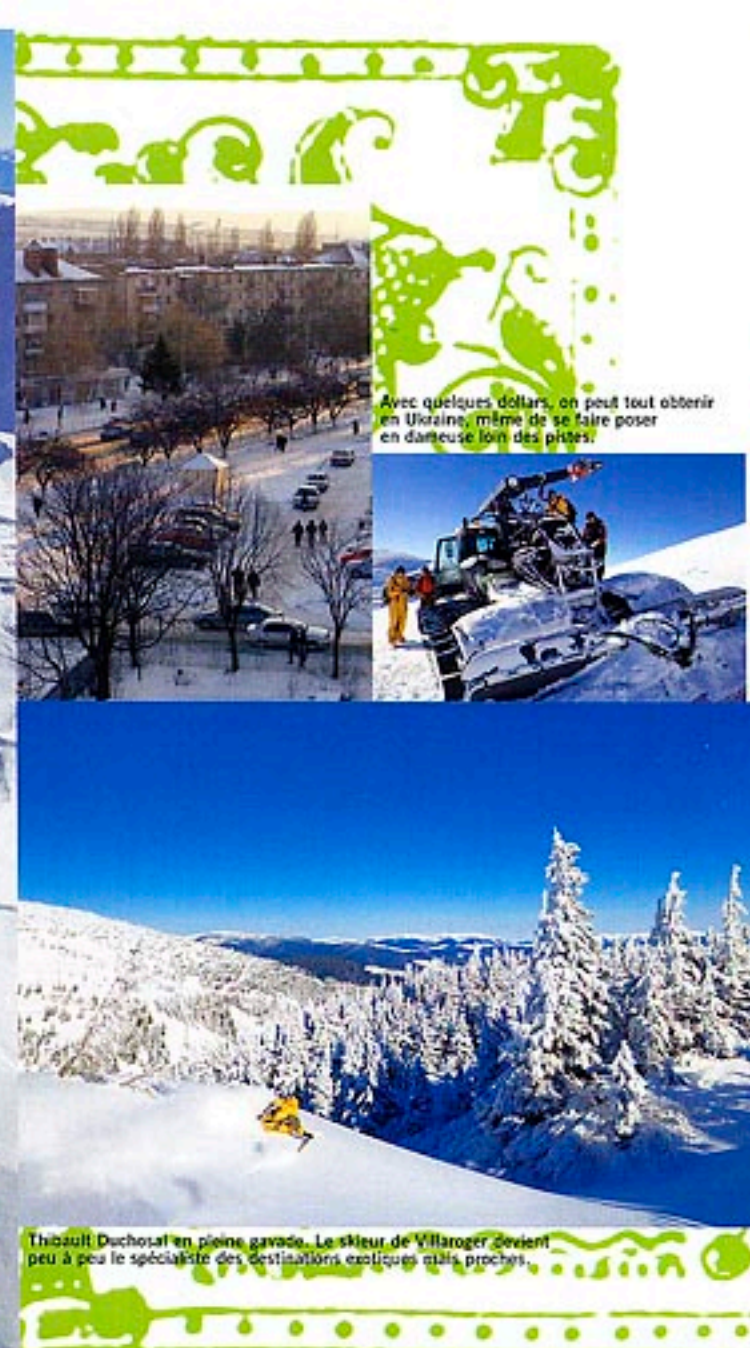
Avec quelques dollars, on peut tout obtenir en Ukraine, même de se faire poser en danseuse loin des pistes!