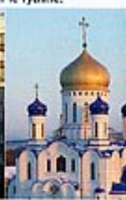
Architecture pas sobre.

Sur les routes verglacées, on double à Mach 12 Trabans et autres Ladas scotchées au pavé tout en évitant les carrioles traînées par des chevaux et les gens qui marchent sur le bas-côté. Ambiance rallye façon Paris-Dakar version enneigée... Entre deux spéciales, on s'offre une petite pause dans un marché local coupé en deux