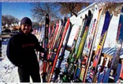
On a beau être sponsorisé, on a pas droit aux derniers gros...