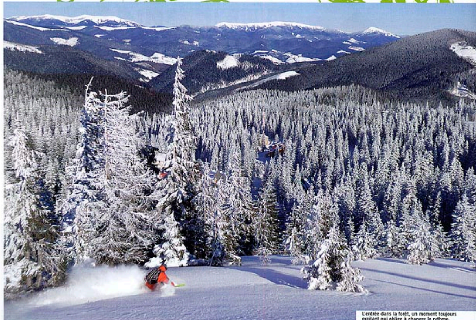
L'entrée dans la forêt, un moment toujours excitant qui oblige à changer le rythme.