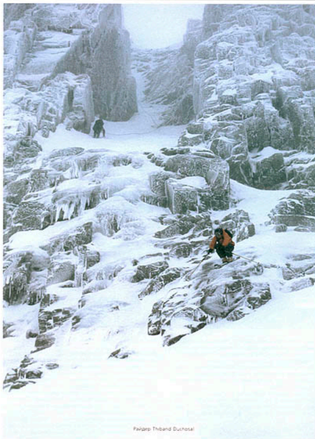
Райдер Thibaud Duchosal

Пряча лица от колючего ветра, мы поднялись на вершину и занялись поисками подходящего для фрирайда места. Помимо хорошего снега нас интересовали глубокие овраги — об их существовании мы узнали на сайте курорта. Не найдя ничего подходящего, обратились к спасателю, чтобы тот подкорректировал направление наших дальнейших поисков. К счастью выяснилось, что он знаком с начальником спасательной службы в Лез-Арке, поэтому его желание помочь нам было безмерным. Но в том месте, что он указал нам, не обнаружилось ничего похожего на нетронутые кулуары — мы подумали: он просто пошутил над нами! Спустились вниз и расспросили его еще раз — выяснилось, что мы забрались правее нужного. На этот раз он поднялся с нами. Наверху, увы, мы поняли, что вряд ли у нас получится сегодня покататься: всю округу заволок туман — спуска не было видно, неизвестно, что ждало нас внизу — пушистый снег или острые скалы.