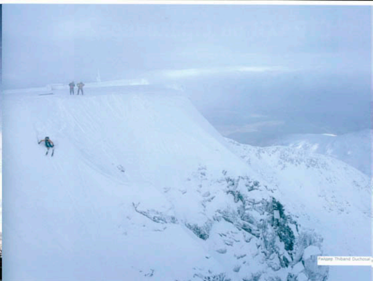
Кэмпар Thiband Duchosa

Наш диалог со спасателем на вершине склона. Спасатель (заметив нерешительность на наших лицах): А у вас есть билтеры? Мы: Дааа!!! Спасатель: Ох! Если что, мы вас сплзем. Этот ответ не добавил нам уверенности, поэтому мы решили не испытывать судьбу и подождать пока распогодится.