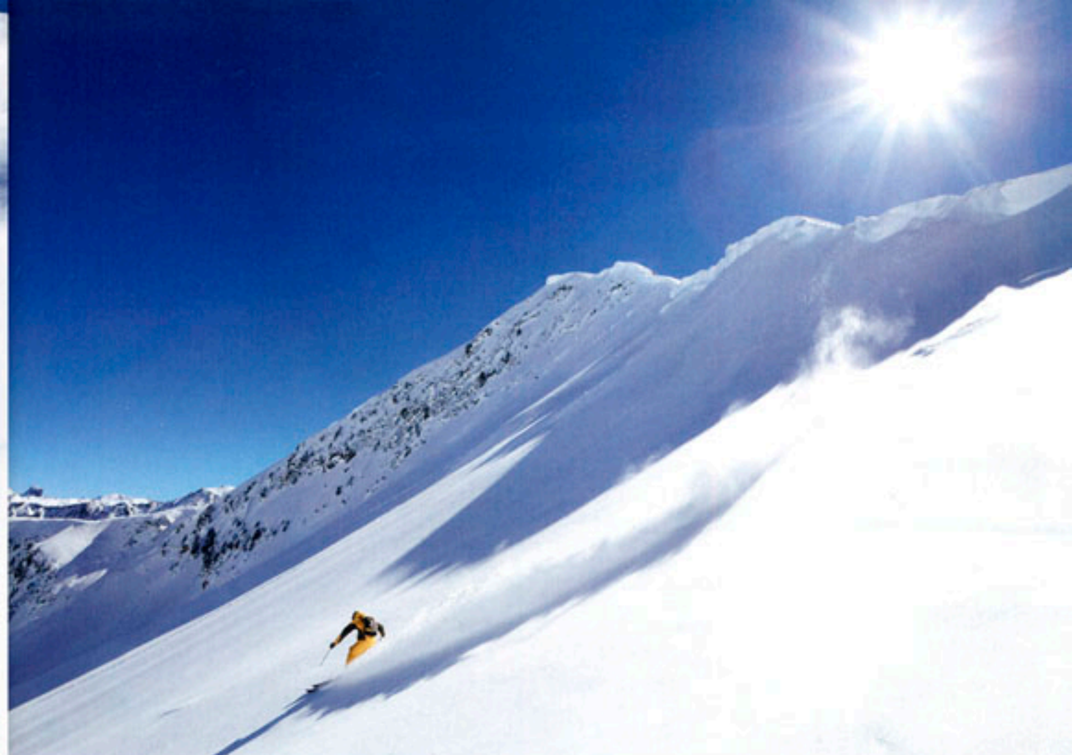
CI-DESSUS: SEUL AU MONDE SUR LE SECTEUR DU PLANAY. PAGE DE GAUCHE: JUMP DANS LES COMBETTES, UN PEU PLAT PARFOIS, MAIS IL Y A QUAND MÊME DE QUOI BIEN S'AMUSER.