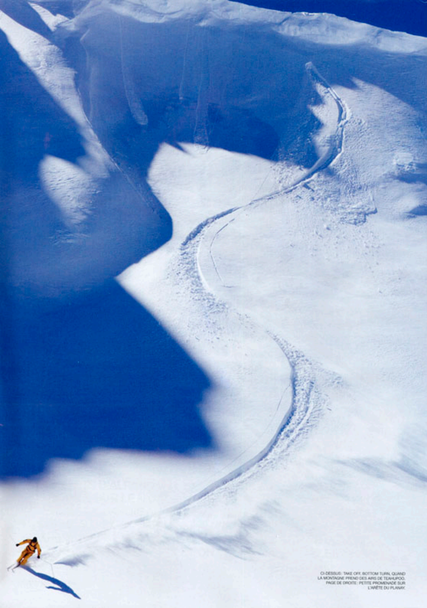
CI-DESSUS: TAKE OFF, BOTTOM TURN, QUAND LA MONTAGNE PREND DES AIRS DE TEAHUPOO. PAGE DE DROITE: PETITE PROMENADE SUR L'ARÊTE DU PLANAY